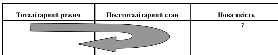
Модель зворотного розвитку