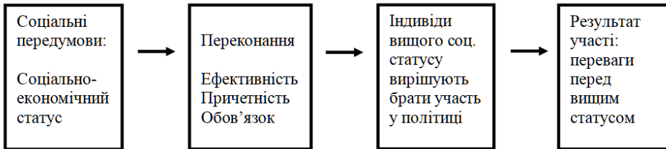
Рис. 2. Передумови політичної участі громадянина за соціально-економічною моделлю С. Верби та Н. Ная *

через призму демократії „там, де незначна кількість людей бере участь у прийнятті рішень, там мало демократії; чим більше залучено людей до політичної участі, тим більше там демократії” [16, с. 1]. Науковці не зупиняються на цьому твердженні і говорять про те, що формально політична участь сприймається як засіб подолання соціальної та економічної нерівності. Проте, незважаючи на те, що у кожного громадянина є право брати участь у політиці, люди з більшим достатком, престижною освітою та вищим соціальним статусом частіше беруть активну участь у політиці. Це може бути пов’язано з наявністю більших ресурсів, професійних навичок, психологічних особливостей та сукупністю інших факторів. Учені стверджують, що „найменшу політичну участь беруть громадяни, кому може знадобитися державна допомога; а ті, хто вже перебуває на вершині ієрархічної стратифікації, ймовірно, будуть більш активними” [16, с. 19]. Зокрема, в стандартній соціально-економічній моделі С. Верба та Н. Най описують передумови політичної участі громадянина (представлено на рис. 2):